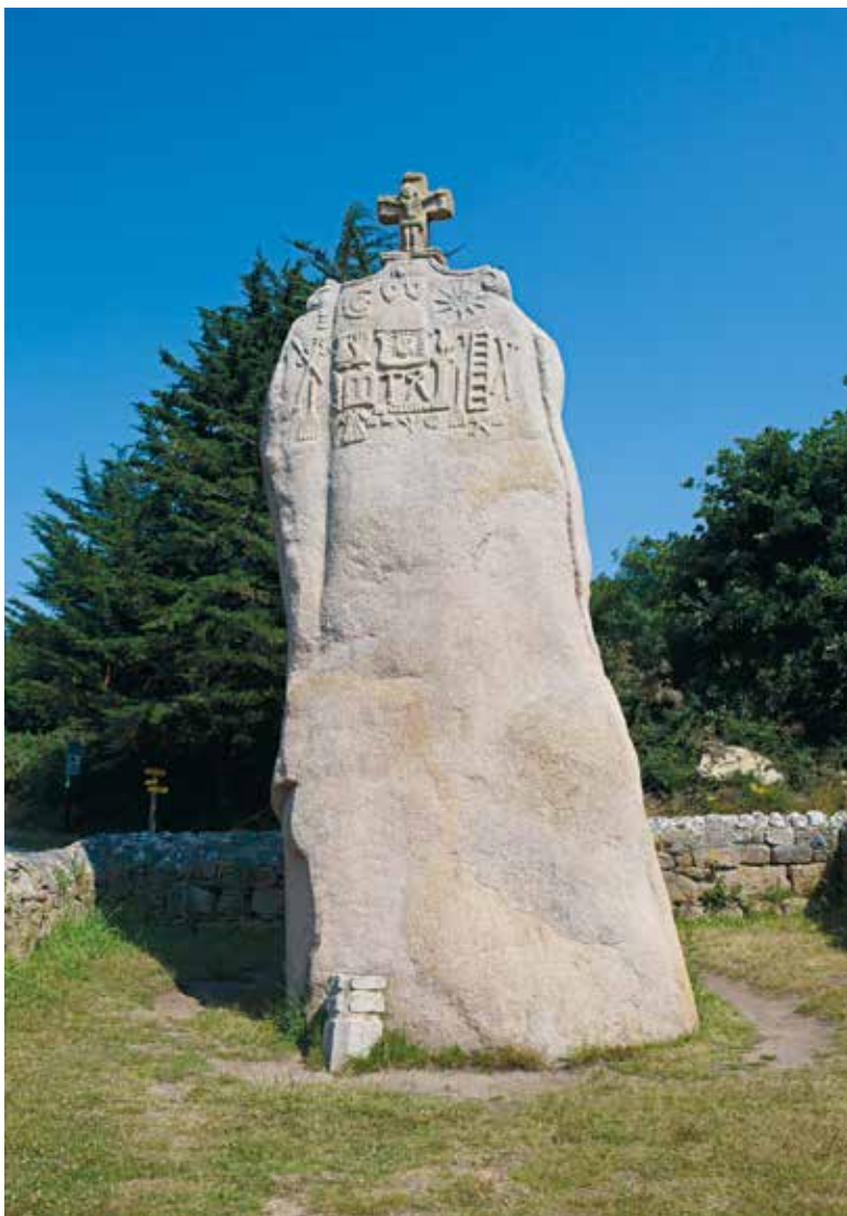
Pravěký menhir Uzec, později „uzurpovaný“ v 17. stol. místní křesťanskou komunitou.