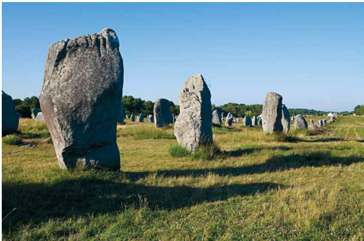
Kamenné řady ze 4. tis. př. Kr. v Karnaku, Bretaň, Francie.